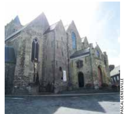
Collégiale de la Crypte.

Vous n'avez toujours pas deviné ? De ce point de vue, qui était auparavant l'emplacement d'un ancien château féodal, on peut découvrir le fouillis pittoresque des vieux toits de la ville, la place d'armes entièrement bossuée de vieux pavés. Plus loin, dans le jardin, nous trouvons la statue équestre du Maréchal-Foch et le vieux mou-