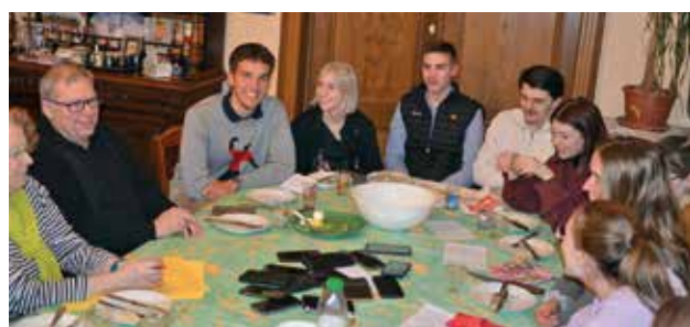
On ne sera pas étonné que tous ont un portable!

Propos recueillis par Marie-Claude Delvaux