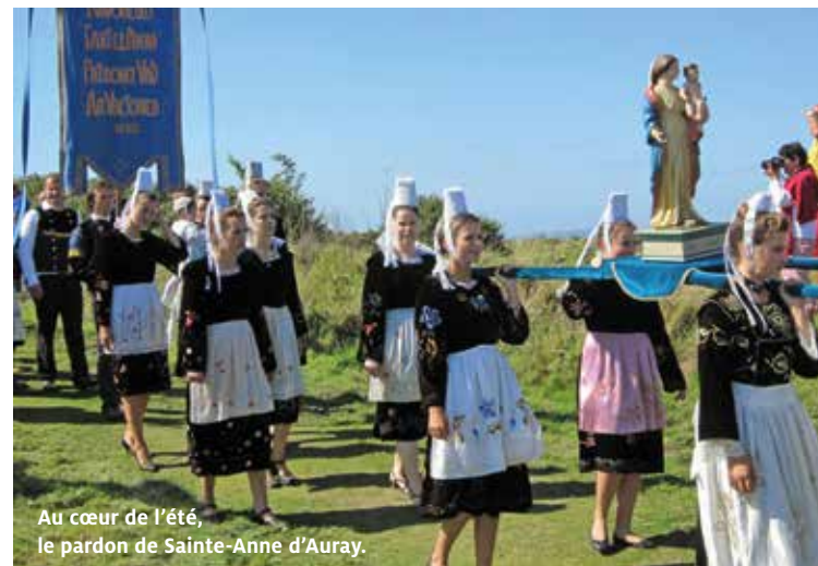
Au cœur de l'été, le pardon de Sainte-Anne d'Auray.

pour dévorer le livre du moment. Et il fallait laisser le cadet dégouter le coin de verdure, ou le plan d'eau, où il pourrait observer à souhait toutes sortes de bestioles inconnues... C'étaient de vrais moments de bonheur! Comme dit le poète: « Petits instants de bonheur ici-bas, échantillons gratuits de l'au-delà. » Les vacances en famille sont des mines de souvenirs joyeux: de retrouvailles d'amis, de lieux évocateurs ou de belles contrées inconnues! On passera, ensuite, de sympathiques soirées entre amis grâce aux photos; on les ressortira avec plaisir aussi, quelques années plus tard, pour se rappeler les meilleurs moments ou... aider une