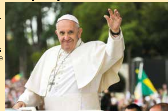
Pape François, exhortation apostolique du 25 mars 2019 (n° 143)

« Jeunes, ne renoncez pas au meilleur de votre jeunesse, ne regardez pas la vie à partir d'un balcon. Ne confondez pas le bonheur avec un divan et ne vivez pas toute votre vie derrière un écran (...) Il vaut mieux que vous laissiez germer les rêves et que vous preniez des décisions (...). Ne survivez pas avec l'âme anesthésiée, et ne regardez pas le monde en touristes. Faites du bruit ! Repoussez dehors les craintes qui vous paralysent, afin de ne pas être changés en jeunes momifiés. Vivez ! Donnez-vous à ce qu'il y a de mieux dans la vie ! Ouvrez la porte de la cage et sortez voler ! S'il vous plaît, ne prenez pas votre retraite avant l'heure !»