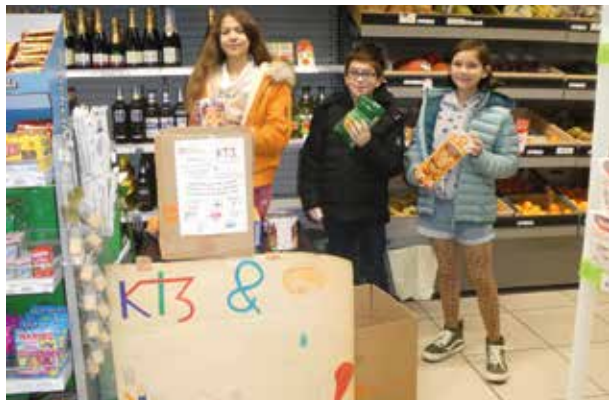
Les enfants devant Proxi au Blanc-Four.