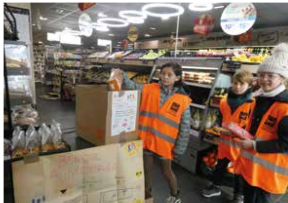
Les enfants devant Carrefour Market au Centre-Bourg.