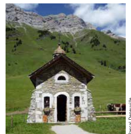
La chapelle au col des Aravis en Savoie.

la Cène, Jésus utilise en effet l'image du crible, une sorte de tamis servant à faire le tri du blé – l'ultime étape consistant à séparer le grain des résidus – pour expliquer la distinction entre le bien et le mal. Le Christ annonce ainsi à ses apôtres que Satan allait «les passer au crible comme le froment», c'est-à-dire qu'il allait les analyser en détail afin de les tenter. Cela signifie de nos jours: examiner minutieusement chaque aspect d'un dossier ou d'une question posée.