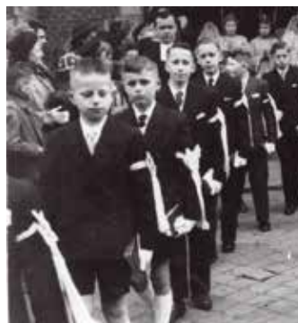
Souvenir de la communion solennelle faite en l'église Saint-Piat de Roncq, le 27 avril 1952.

Dans les années 1950, à Saint-Piat, les communicants se rassemblaient au cercle paroissial, rue du Docteur Gallissot, et partaient en procession jusqu'à l'église. Les filles portaient une robe de communicante, et les garçons un costume avec un brassard blanc. Puis, au début des années 1960, garçons et filles ont tous revêtu une tunique blanche qui descendait jusqu'aux pieds. Elle est appelée «aube» du mot latin alba ,