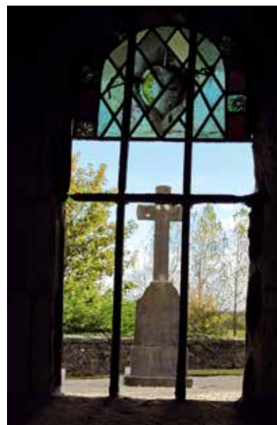
Crypte de l'église de Saint-Marcouf en Normandie.

Cette expression fait référence à la Genèse dans laquelle Ève croque le