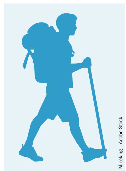
Prends soin aussi de ton corps!

Composez la référence indiquée sur internet et vous accédez au texte complet.