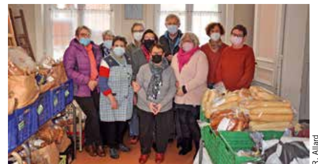
L'équipe Saint-Vincent-de-Paul à Saint-Roch.