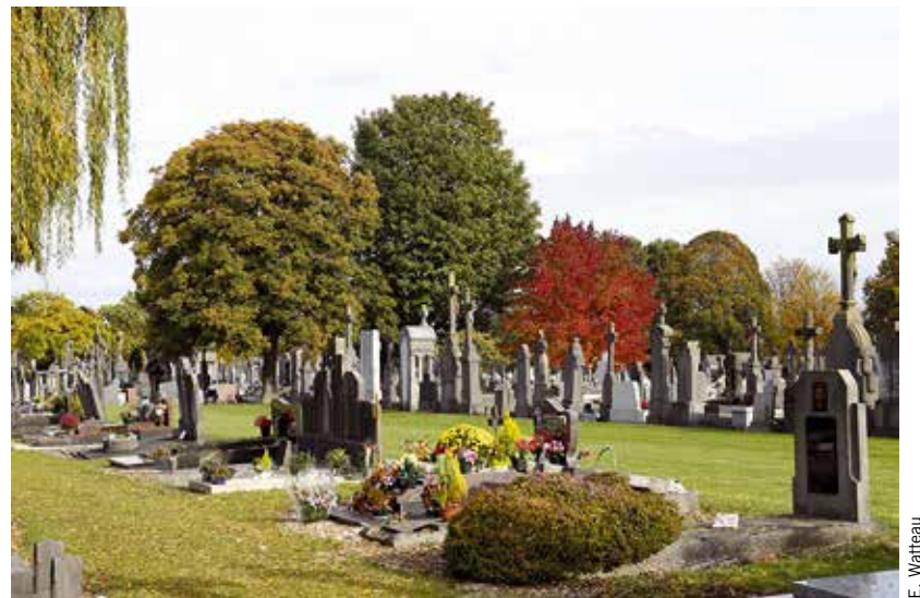
Cimetière du Pont-de-Neuville à Tourcoing.

La mort, le deuil, le chagrin sont des étapes de la vie dont ne doivent être exclus ni les adolescents ni les petits enfants. Même si ces derniers ne comprennent pas tout, ils savent percevoir une émotion et comprendre qu'il se passe quelque chose de sérieux. Dans le même temps, il faut les rassurer : la plupart des maladies, surtout celles qu'ils attrapent, peuvent être guéries grâce aux progrès de la médecine. Mais d'autres, pour les personnes très âgées, sont plus compliquées à guérir. Cette étape d'explication du décès de leur mamie à ses petits-enfants est un moment difficile, et il est important d'annoncer ce décès à tous les petits-enfants en même temps afin qu'ils ne l'apprennent pas par d'autres personnes.