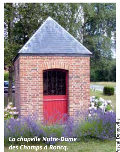
La chapelle Notre-Dame des Champs à Roncq.

Autant dans l'Ancien que dans le Nouveau Testament, Dieu met son peuple en garde contre la malhonnêteté, en usant en particulier de l'exemple de la balance qui ne devait pas avoir un poids pour le riche et un autre pour le pauvre: « La balance fausse est en horreur à l'Éternel, mais le poids juste lui est agréable » (Proverbes 11:1). « Deux sortes de poids, sont l'un et l'autre en abomination à l'Éternel » (Proverbes 20:10).