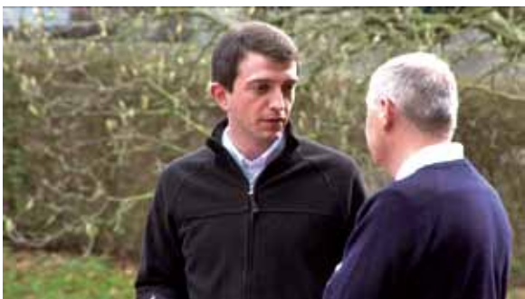
Chaque séminariste est accompagné personnellement par un prêtre.