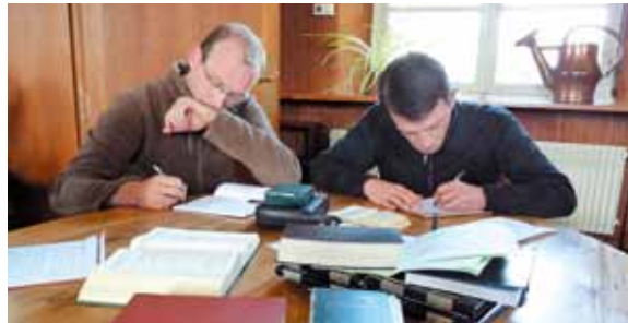
Individuellement, ils approfondissent aussi leur intelligence de la foi.