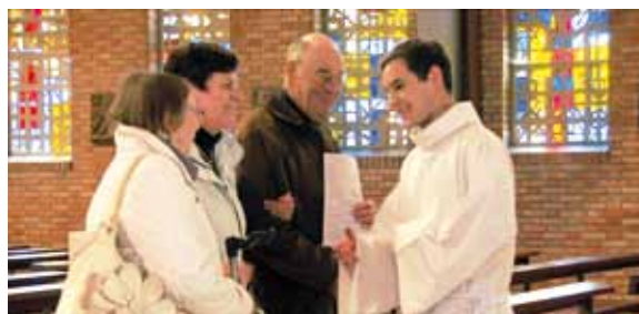
En premier cycle, les séminaristes rejoignent deux fois par semaine une communauté à proximité de Lille.