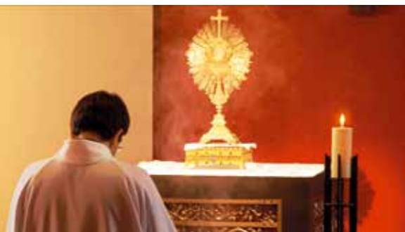
Au fil des années, chaque séminariste approfondit sa relation au Christ.