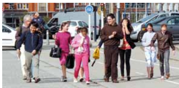
En second cycle, ils sont envoyés en insertion pastorale sur un terrain qu'ils ne connaissent pas. Là, ils sont invités à se laisser déplacer par les personnes, les événements pour servir les communautés chrétiennes et ceux que l'Eglise ne rejoint pas encore.