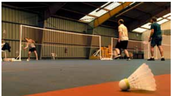
La pratique du sport permet aussi de trouver un équilibre.