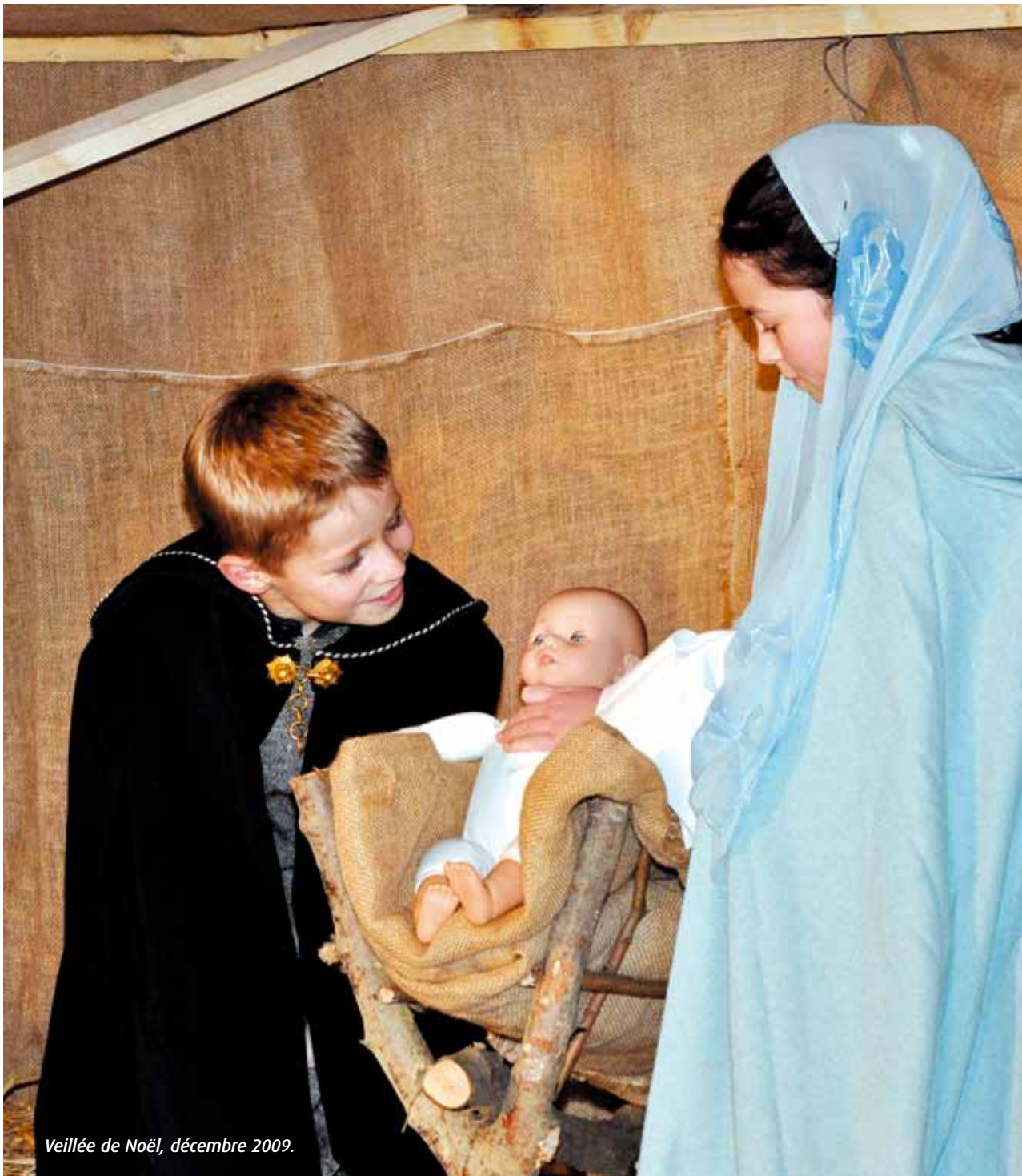
Veillée de Noël, décembre 2009.

Décembre 2012. numéro 158. bimestriel. 1,50 €. abonnement annuel 9 €.