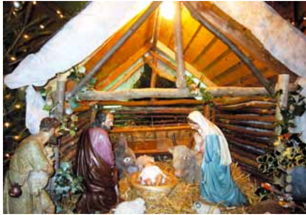
Crèche de Saint-Piat, 2011.

Ainsi, depuis plusieurs années, la crèche de Noël subit-elle les assauts de ces drôles de "croisés". De la place de la Déesse à Lille jusqu'au parc municipal de Leers, en passant par les vitrines des commerçants,