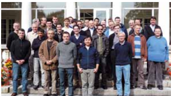
Le séminaire, c'est d'abord, une vie communautaire.