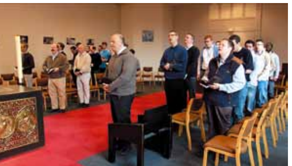
Des laudes aux complies, la prière rythme la vie de la communauté et renvoie à l'essentiel.