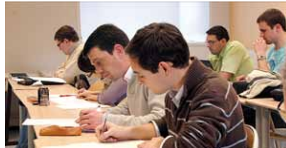
Au séminaire et à l'Université catholique de Lille, les séminaristes suivent des enseignements de sciences humaines, philosophie, théologie et pastorale.