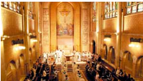
L'eucharistie célébrée chaque jour est un temps ouvert à tous.