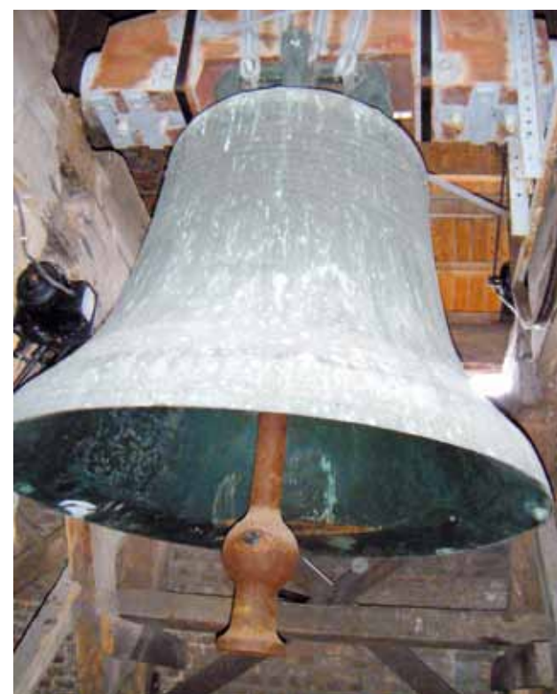
Cloche "Marie-Raphaëlle" (2100 kg), l'église Saint-Piat.