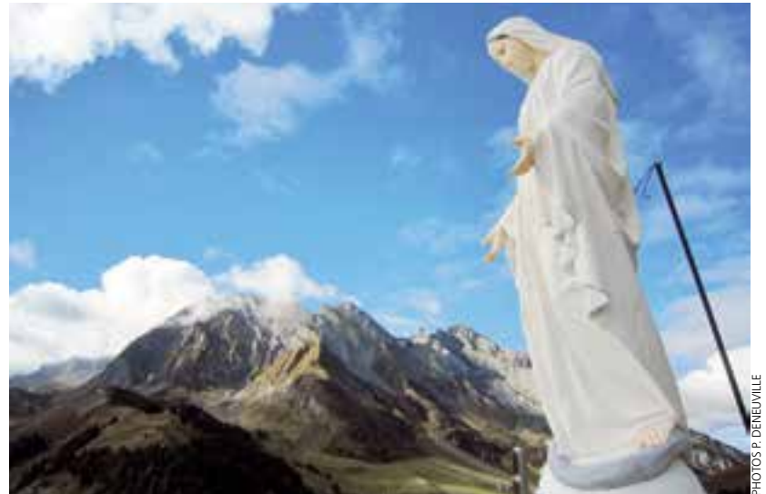
La Vierge du Chatelard dans le massif des Aravis en Savoie.

Ces croix et oratoires sont là aussi pour rappeler aux habitants de la vallée la dévotion des anciens qui vivaient dans le respect de leurs traditions chrétiennes sans crainte de s'extérioriser. De nombreux massifs alpins sont pourvus de magnifiques croix, soigneusement entretenues et même parfois complètement restaurées. Dernière-ment, à Saint-Jean-de-Sixt en Haute-Savoie, une association a pris l'initiative de remplacer la croix vieillissante du sommet du Suet. Les habitants et randonneurs étaient invités à acheminer cette belle croix le long d'un haut sentier jusqu'au sommet de la montagne.