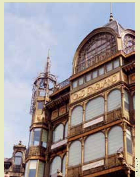
Le Musée des instruments de musique de Bruxelles.

Renseignements : Écris - 7 rue de la Briqueterie à Roncq icridis@laposte.net