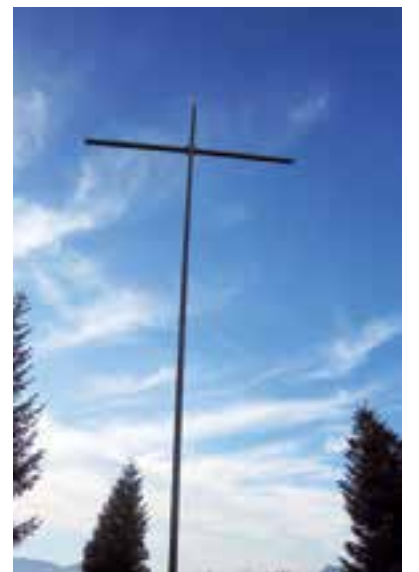
La croix de Colomban sur le plateau de Beauregard à La Clusaz en Haute-Savoie.