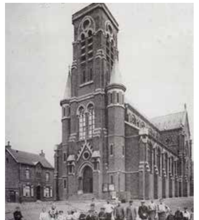
L'église Saint-Roch vers 1907.

Pendant la guerre 1914-1918, la ville de Roncq est occupée par les Allemands. En 1922, une plaque commémorative reprenant le nom des enfants de la paroisse morts pour la France sera installée dans l'église Saint-Roch. Le monument aux morts