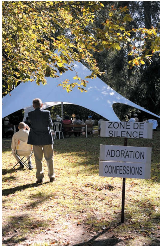
Corinne Mercier - Cific