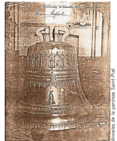
La cloche «Marie-Raphaël» bénite le 10 décembre 1899, enlevée par les Allemands en 1917.