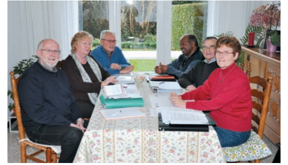
L'équipe des 5 laïcs.