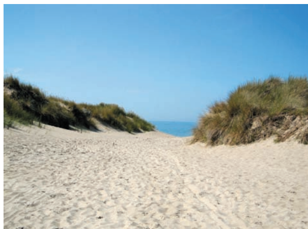
Le sable et les dunes...