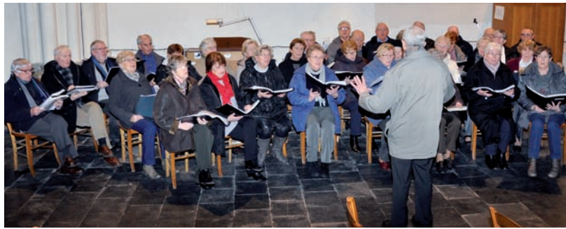
La chorale In Memoriam.