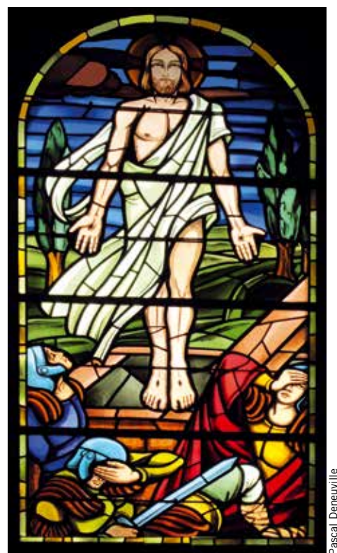
Vitrail du Christ ressuscité, église de Thônes en Haute-Savoie.

Cette expression, qui veut dire qu'il ne faut pas se soucier de ce qu'on perd, puisque le temps nous en donnera dix fois plus, prend le contre-pied de la parabole biblique de l'évangile selon saint Luc : «Quelle femme, si elle a dix drachmes, et qu'elle en perde une, n'allume une lampe, et ne cherche avec soin, jusqu'à ce qu'elle la retrouve ?» (Luc 15:8). Traduction : La ménagère qui a perdu une de ses pièces n'a de cesse de chercher celle qui lui manque, car, sans elle, son «trésor» n'est pas complet. Actuellement, cette expression, qui est toujours utilisée, signifie que les choses paraissant importantes, voire indispensables, peuvent être plusieurs fois remplacées.