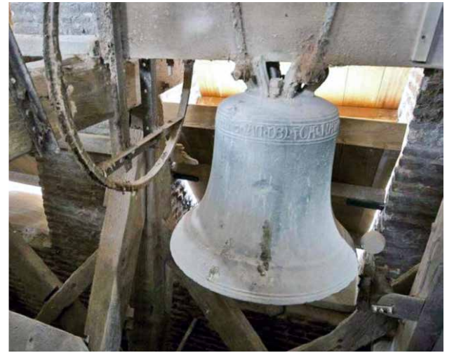
Landas possède une des plus vieilles cloches de France.

À Roncq, comme dans toutes les paroisses, on ne conçoit pas un clocher d'église sans cloches, sauf pendant les derniers jours de la semaine sainte puisqu'elles sont censées partir à Rome et ne revenir que le dimanche de Pâques... Pourtant, ce fut un tout autre périple que les cloches de nos deux églises Saint-Piat et Saint-Roch accomplirent en 1917.