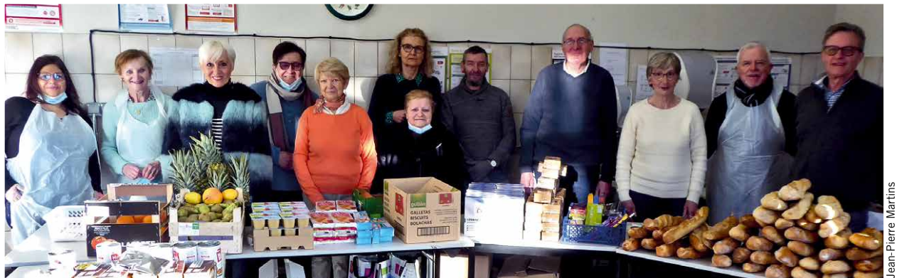
L'équipe des bénévoles, démasqués le temps de la prise de vue.