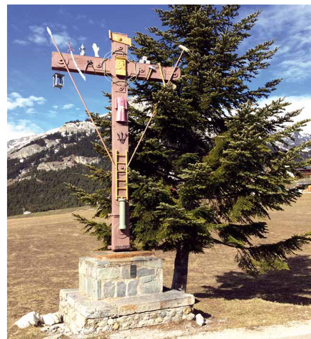
Croix de la Passion à Aussois en Maurienne, restaurée en 1980, d'une croix originale de 1901.