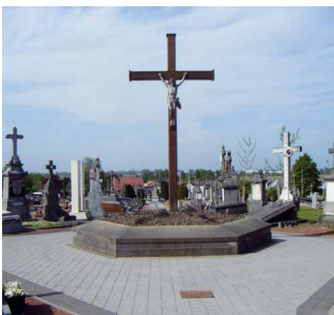
Avant le 12 mars.

➔ a enfin pu retrouver ses amis jardiniers au Jardin de Raoul au bois Leurent. En respectant les gestes barrières, ils se sont attaqués dans un premier temps à la taille des arbres fruitiers qui avaient pris un peu trop d'aise pendant la période de confinement. Viendront ensuite le nettoyage des parcelles et les premiers semis. Ils attendent avec impatience de revoir leurs trente-cinq adhérents, ainsi que la visite des scolaires dès que les conditions sanitaires le permettront.