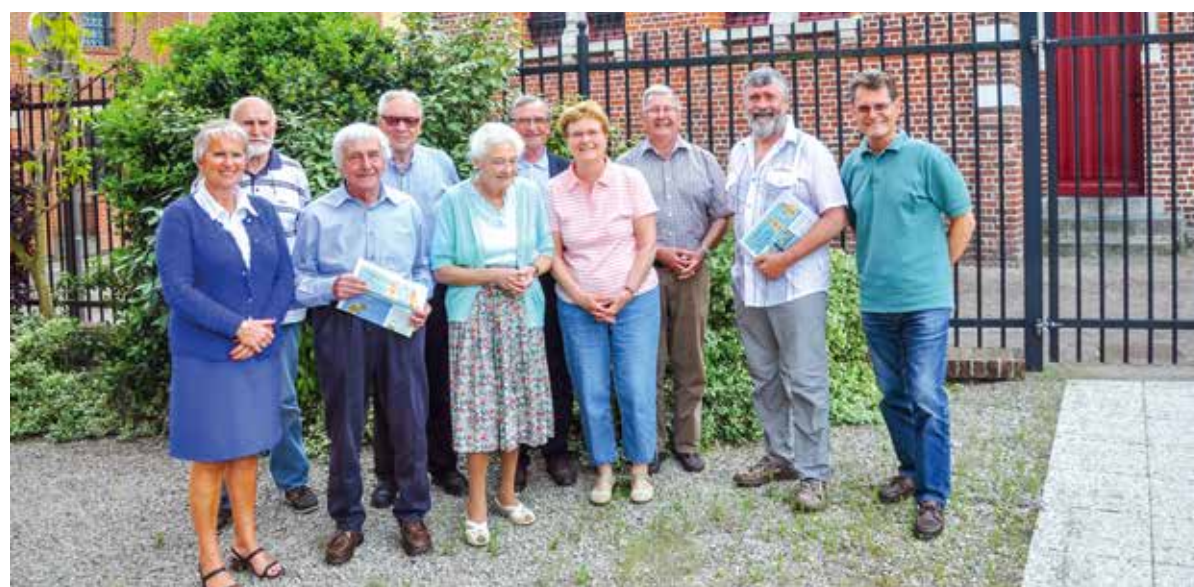
Une partie de l'équipe du journal.

Mais avant tout chose la vie d'une paroisse, c'est l'affaire des hommes et