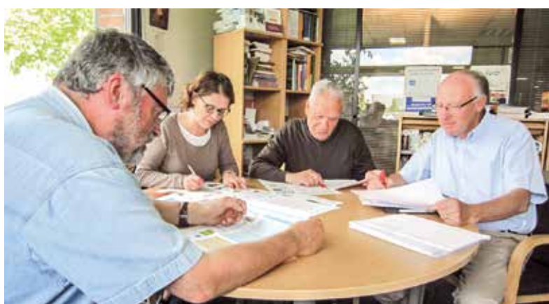
La relecture du journal chez Bayard Presse.