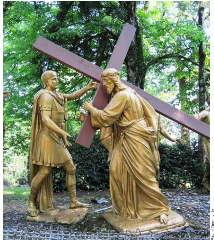
Le chemin de croix à Lourdes.

Des millions de chrétiens commémorent le dimanche de Pâques la résurrection de Jésus-Christ, trois jours après sa crucifixion. Pâques, dont la date change chaque année, marque aussi l'arrivée des beaux jours et de la nouvelle saison. Elle a en effet toujours lieu le premier dimanche suivant l'équinoxe de printemps, et ce en vertu d'une règle adoptée en l'an 325 lors du concile de Nicée. La religion juive célèbre aussi la Pâque (sans «s») à chaque printemps. Cette fête est appelée Pessah . Elle rappelle la libération des juifs qui étaient esclaves des pharaons égyptiens.