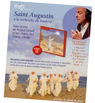
Saint Augustin, à la recherche du bonheur, CD produit par Rejoyce musique.

J'ai une foi sous-jacente, dès ma jeunesse, avec une mère catholique non pratiquante et un père libre-penseur.