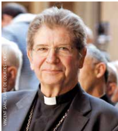
VINCENT SANCTUARE DE LOURDES - CHIC

On ne peut pas oublier que la doctrine sociale de l'Église, dont il est question