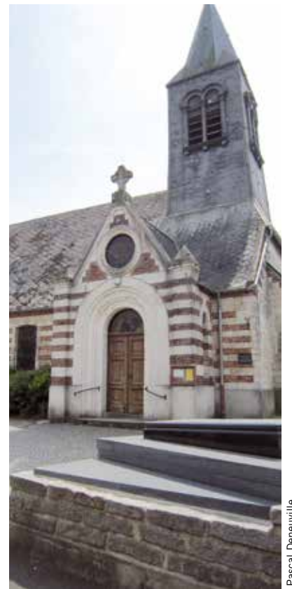
Église de Walincourt dans le Nord.