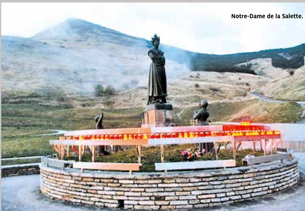
Notre-Dame de la Salette.