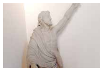
Trésor caché à Saint-Piat, redécouvrons la statue de saint Pierre