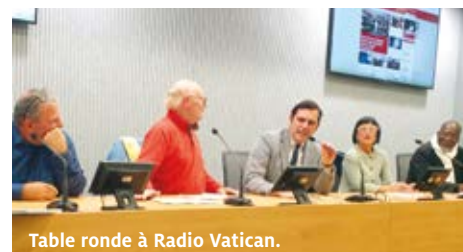
Table ronde à Radio Vatican.