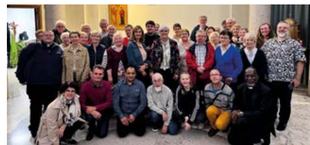
Après la messe de notre pèlerinage.