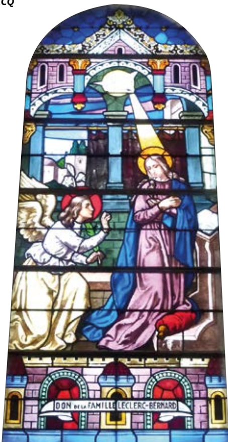
Vitrail de l'Annonciation (Lécluse). Gabriel porteur d'une bonne nouvelle à Marie.