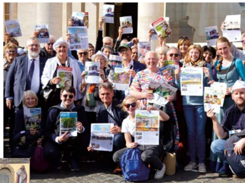
Les membres d'équipes avec leur journal.