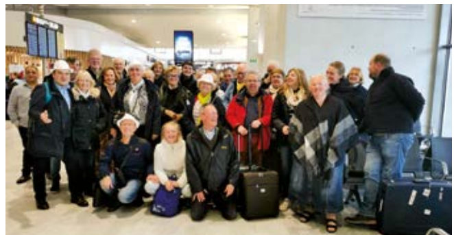
Lors du départ pour Rome.