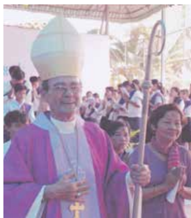
Avec la communauté catholique du Cambodge.

Après un séjour à Paris où il enseigne la théologie et travaille pour le rapprochement des Églises de France et d'Asie, il part comme missionnaire au Brésil durant dix années.