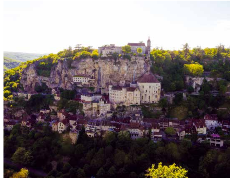
Rocamadour à Notre-Dame de Rocamadour.