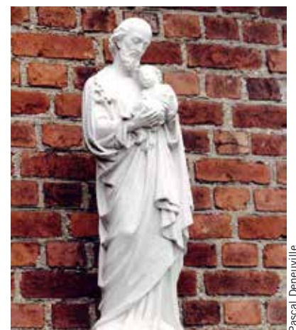
Statue de saint Joseph dans la cour de l'école Saint-Joseph à Roncq en 1987.

La tradition a souvent attribué aux saints des pouvoirs qu'ils n'ont pas: retrouver des objets perdus, protéger les conducteurs ou prendre soin de telle ou telle corporation en particulier à